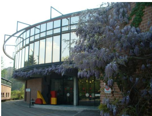
Laboratorio Chimico Camera di commercio di Torino Via Ventimiglia, 165